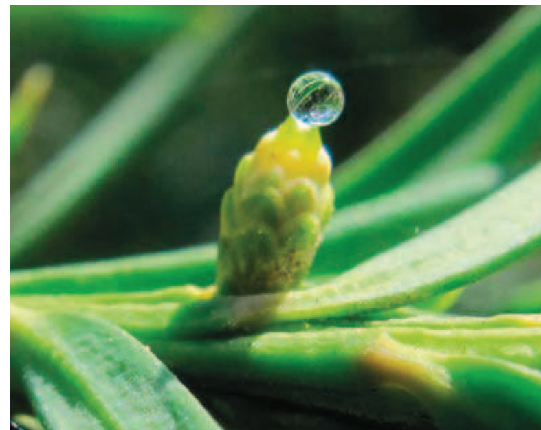
Detalle de flor femenina con gota micropilar que permite la adherencia de los granos de polen

El grano de polen de T. baccata tiene el mayor tamaño de todas las gimnospermas pero también es de los más ligeros (Thomas y Polwart, 2003). La polinización en el tejo es anemófila y ocurre de febrero a marzo siendo de las más tempranas junto a la de avellanos, sauces y olmas. Cuando el polen llega a la flor femenina en condiciones óptimas es atrapado por una gota micropilar incolora que será posteriormente reabsorbida por la nucela y dirigida hacia el óvulo (Ruguzov y Sklonnaya, 1992). La fecundación se completa a las 6/8 semanas (Hejnowicz, 1978) y empieza a formarse el primordio seminal y la parte carnosa o falso fruto que lo envuelve. La madurez va normalmente de septiembre a mitad de noviembre, aunque se han visto árboles con frutos ya maduros a mediados de julio.