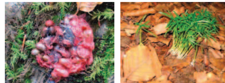
Nascencia múltiple de plántulas procedentes del excremento de un pequeño mamífero. Llama la atención el gran éxito en la germinación de las semillas tras haber pasado por el tránsito digestivo del animal dispersor. El ambiente donde se desarrollan es un hayedo palentino con dosel cerrado que, lamentablemente, no las dejará prosperar.

que forma, en estaciones óptimas, doseles cerrados, monoespecíficos y pobres en especies. En este sentido, el hombre ha potenciado, mediante una silvicultura orientada a fines meramente productivistas, la expansión de masas puras de haya en muchas áreas de la cornisa cantábrica (Schwendtner, 2008) en detrimento de otras formaciones mixtas que permiten mayor entrada de radiación solar y ejercen a su vez un efecto facilitador o protector (sobre todo durante épocas desfavorables), posibilitando el recambio y la estabilización del regenerado. En el caso de la cuenca del Sil son los pujantes bosques mixtos de robles, algunos encinares méxicos e incluso formaciones subriparias de arroyos de alta montaña, los que albergan incipientes núcleos de tejos en la actualidad debido a sus condiciones óptimas como hábitat potencial tras mitigarse en las últimas décadas la presión ejercida por actividades humanas.