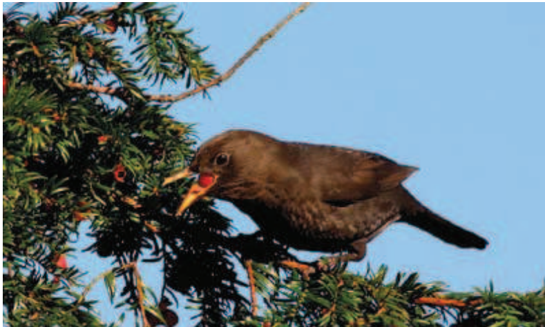
Ejemplar hembra de mirlo ( T. merula ) a punto de engullir un fruto de tejo.

Sin embargo, no son los pájaros sus únicos consumidores o diseminadores. T. baccata es una especie de amplia distribución que, en un gradiente norte – sur, se extiende desde las costas noruegas y suecas, a los fríos bosques continentales centroeuropeos llegando hasta el sur mediterráneo y las cordilleras norteafricanas occidentales. Así, el tejo es ramoneado en áreas cercanas al círculo polar por renos ( Rangifer tarandus ), aunque sus frutos también son consumidos en su límite meridional de distribución por macacos de berbería ( Macaca sylvanus ) en el Medio Atlas (Mehlman, 1988) y, probablemente también, en las últimas tejadas del Riff marroquí y del macizo de los Aures en Argelia. En la Península Ibérica, es fácil observar gran cantidad de semillas de esta especie en los excrementos de zorros ( Vulpes vulpes ), jabalíes ( Sus scrofa ), garduñas ( Martes foina ), comadreas ( Mustela nivalis ), tejones ( Meles meles ) y otros mustélidos que contribuyen a facilitar una, quizás minusvalorada, cantidad de nuevos reclutas de tejo en los bosques mediterráneos y atlánticos. Algunas de estas especies de mamíferos poseen incluso la facultad de comportarse como diseminadores a media y larga