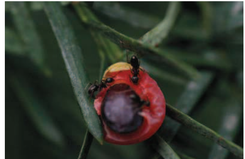
Detalle de hormigas alimentándose del arilo y liberando a la semilla incluso en el propio árbol.

Aunque de predicción lógica, uno de los casos no documentados más curiosos que se han detectado es el de hormigas alimentándose de arilos, dejando a la semilla libre del envoltorio carnoso.