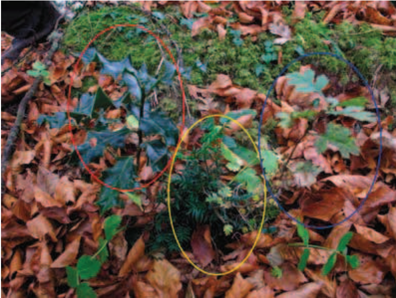
De derecha a izquierda se observan plántulas de acebo, tejo y espino de igual edad que, muy posiblemente, emergieron de frutos consumidos al mismo tiempo y diseminados en el mismo pulso de dispersión. Si sobreviven a la vulnerabilidad de los primeros tres a cuatro siguientes años, el acebo y el espino facilitarán la protección del tejo frente a herbívoros hasta que este último alcance el tamaño necesario para sobrevivir al ramoneo. Representan un claro ejemplo del proceso de interacción mutualista planta-planta que sucede principalmente en las tejedas de la mitad norte peninsular.